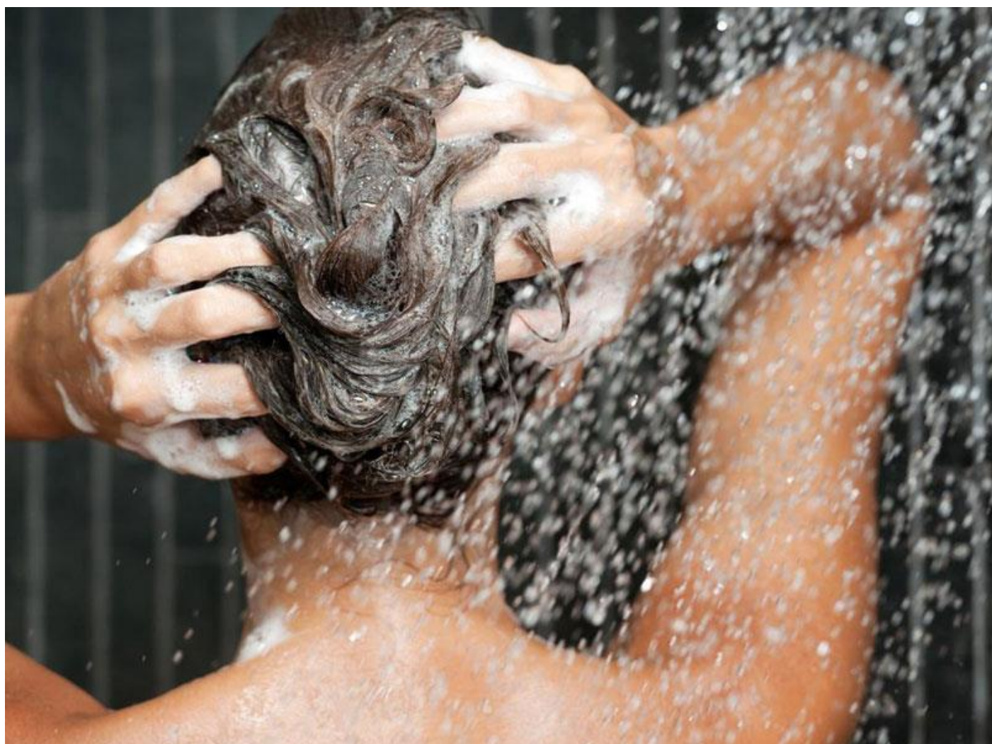
شستشو با شامپو ضد شوره

وقتی صحبت از مواد اولیه یک شامپو به میان باشد باید بگوییم که با انواع مختلفی روبرو خواهید بود. در ادامه برخی از رایج‌ترین مواد اولیه را که نقش بیشتری در درمان شوره مو خواهند داشت، برایتان فهرست کرده‌ایم: