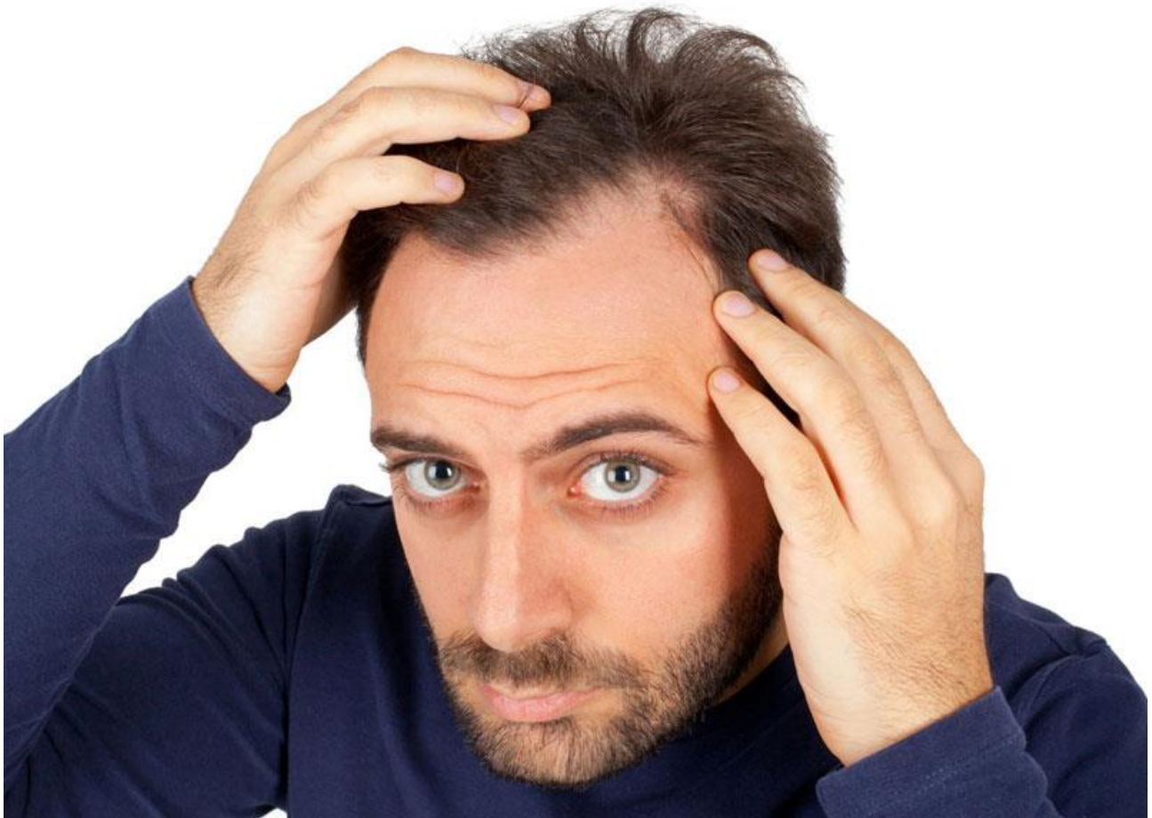
عوارض جانبی استفاده از شامپو ضد شوره

درست مثل هر محصول دیگری که برای درمان وضعیتی در بدن انسان طراحی شده، برخی عوارض احتمالی نیز در این محصول وجود دارد که باید درباره‌اش بدانید. در ادامه این عوارض جانبی را برایتان فهرست کرده‌ایم: