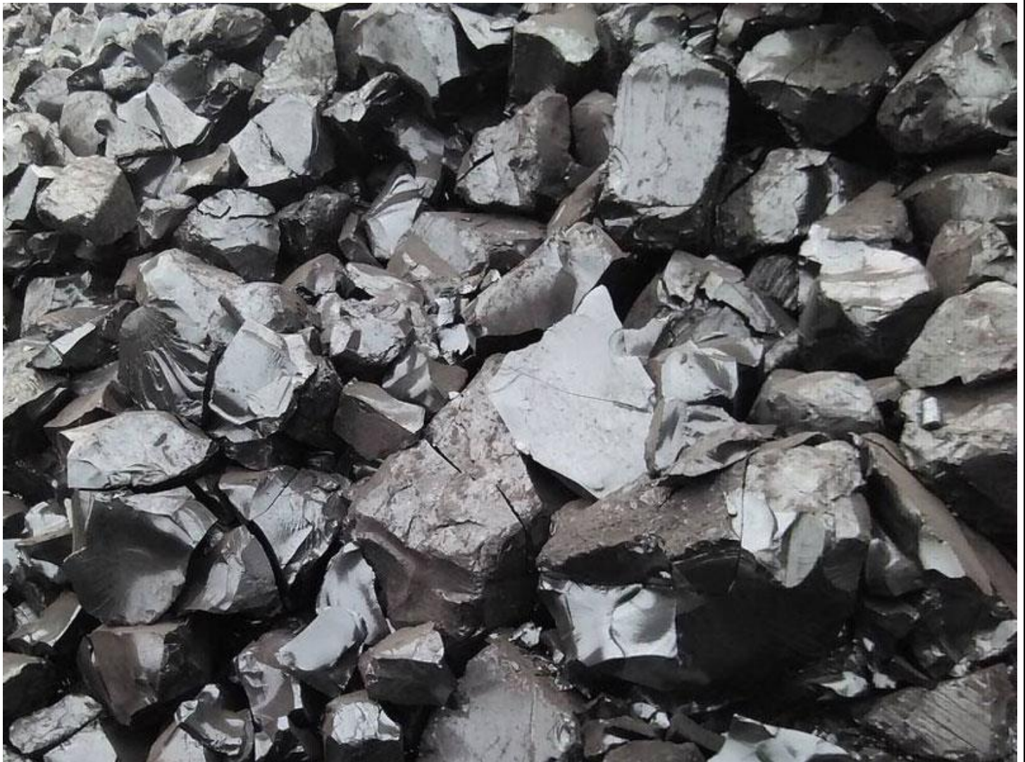
قطران زغال سنگ